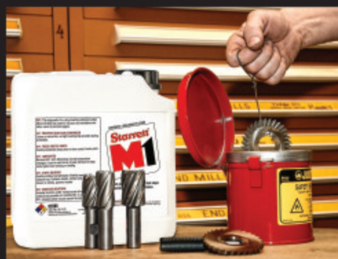
用于工业应用的散装M1包括1加仑罐、5加仑提桶和53加仑桶装。

M1使用较大的容器，经济实用。也可使用可再次填充润滑剂的喷雾罐，以节约成本、防止产生多余的废物以及无需处置空罐。